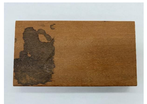
塗ってしばらくすると綺麗になりました