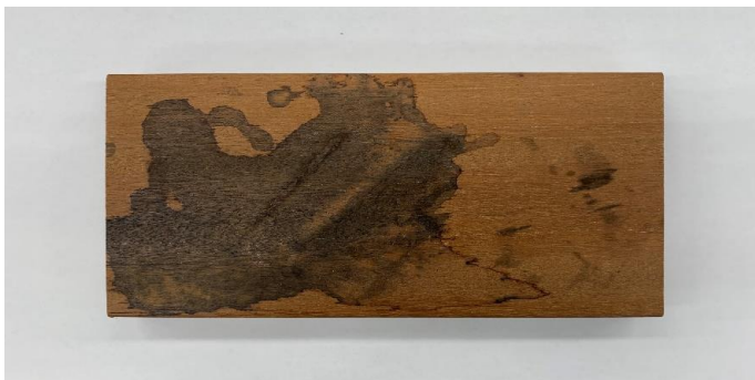
墨汁をこぼしたようなひどい鉄じみ

上記のような原因で木材の持っている“タンニン”と金属イオンが反応し黒いシミを作ります（カビには効果はありません）